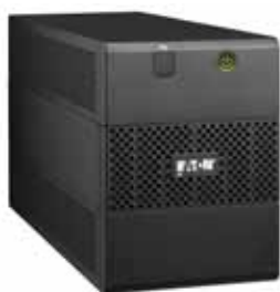
5E 1100 USB